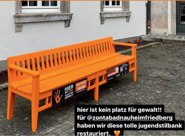
hier ist kein platz für gewalt!! für @zontabadnauheimfriedberg haben wir diese tolle jugendstilbank restauriert. ❤️

“Hier ist kein Platz für Gewalt!” In 2023 ist es uns gelungen, eine Bank und Sponsoren zu finden. Die Jugendstil-Bank der Musikschule musste erst von Grund auf restauriert werden.